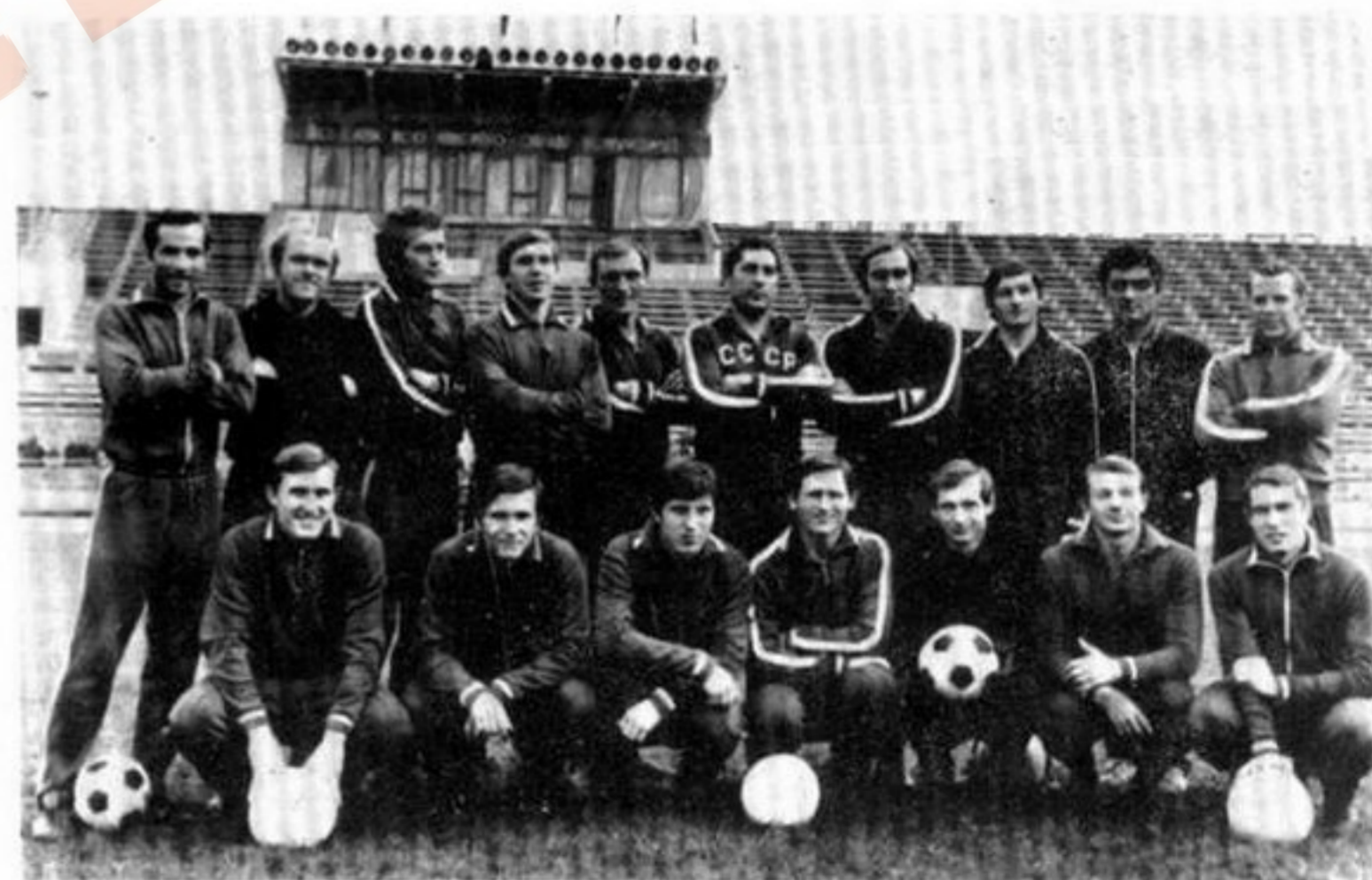
Šampion Sovietskeho zväzu vo futbale ZARJA Vorošilovgrad

От всего сердца приветствуем вас на нашем стадионе. Желаем вам, чтобы вы чувствовали себя у нас очень хорошо, чтобы ваше пребывание в Трнаве и в Чехословацкой социалистической рес- публике оставило в вас самые лучшие воспоминания.