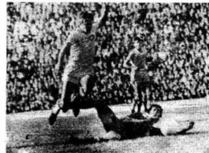
1971 г. Эпизод из матча сборных СССР и Испании