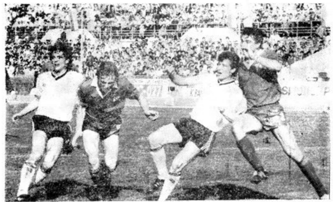
28 мая 1988 г. Финал Кубка СССР — «Металлист» — «Торпедо» — 2:0. Харьковчане (в темной форме) защищаются.

И в розыгрышах Кубка Югославии футболисты Баня-Луки успешно выступали в семидесятые годы. Именно на этот период приходится и высшее достижение (не принимая во внимание победу в последнем турнире).