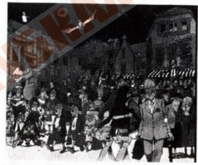
ბრემენი დიდი ფეხბურთის დღეს...