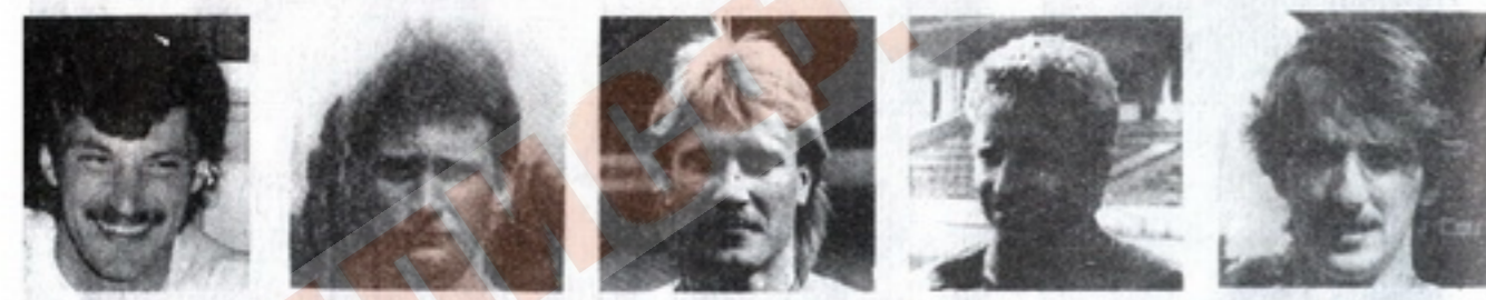
● მანსანი ● ნოიბარტი ● რილა ● ბუგსმიულარი ● ოადენვიტი