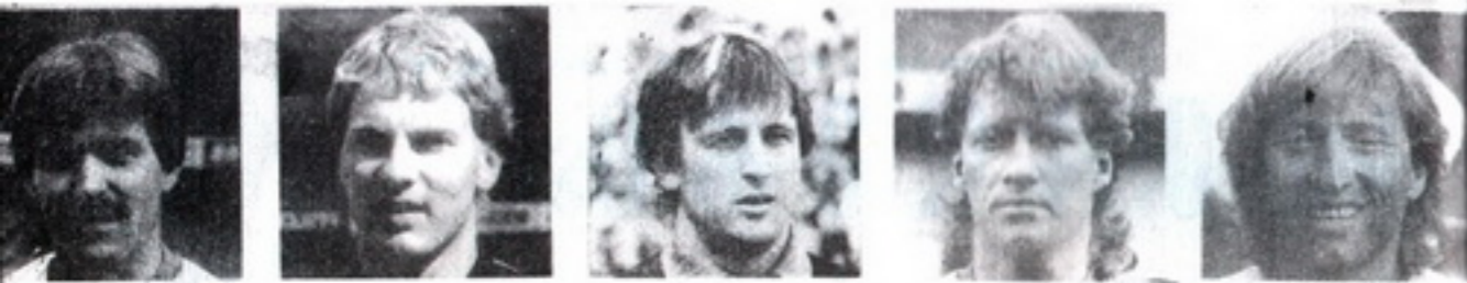
● ვოტავა ● გურდენსკი ● რეკი ● ზაუბადი ● კუტსოვი