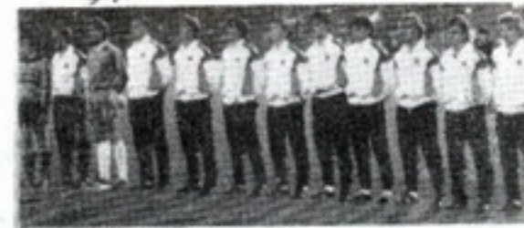
Сборная ФРГ на чемпионате мира в Мехико — 86.