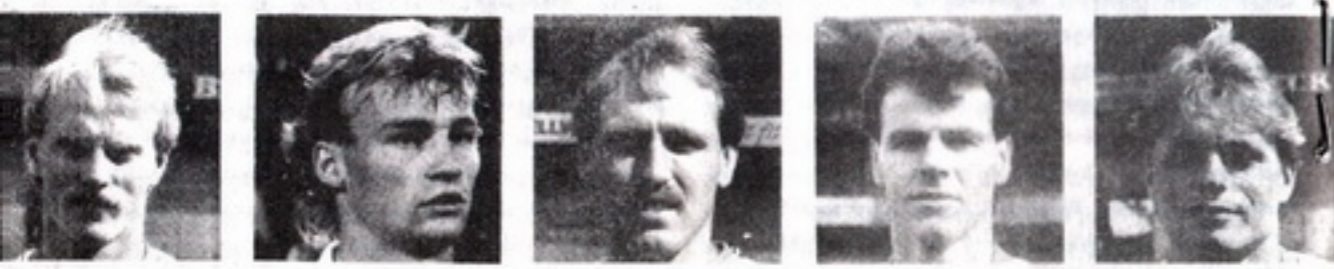
● შააფი ● აულანდარი ● ობენი ● ბატსები ● გოკოვია