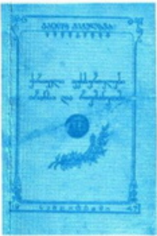
გ. ჩეჩელავას წიგნის უცხო რეპროდუქცია

აი ამ შემადგენლობით ითამაშეს თბილისის დინამოელებმა 1945 წელს რუმინეთში