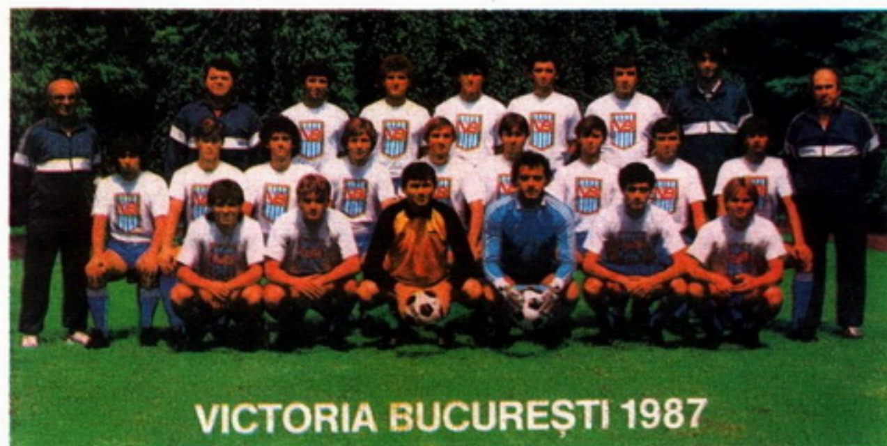
VICTORIA BUCUREȘTI 1987

На фоне этих трёх грандов румынского футбола много скромнее выглядит наш сегодняшний соперник — команда бухарестской «Виктории», история которой насчитывает всего 17 лет. Ну а дебют команды в высшей лиге чемпионата страны состоялся и того позже — осенью 1985 года на своём 8-тысячном стадионе. Сезон принёс клубу скромное 12-ое место, хотя специалисты расценивали это успехом для новичка Большого футбола. В прошлом году «Виктория» дерзко замахнулась на более высокое место: в 34 матчах одержала 13 побед, набрала 38 очков (мячи 43—39), заняв почётное третье призовое место после «Стяуа» и «Динамо». «Виктория» получила право впервые выступать в престижном европейском турнире — розыгрыше Кубка УЕФА. Два стартовых матча оказались успешными, хотя соперник был не из сильных — команда ЭПА (Ларнак, Кипр). Румыны победили, как известно, дважды — 1:0 (в гостях) и 3:0 (дома).