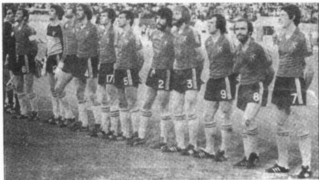
... СИНКЕ: Сборная команда Бельгии.