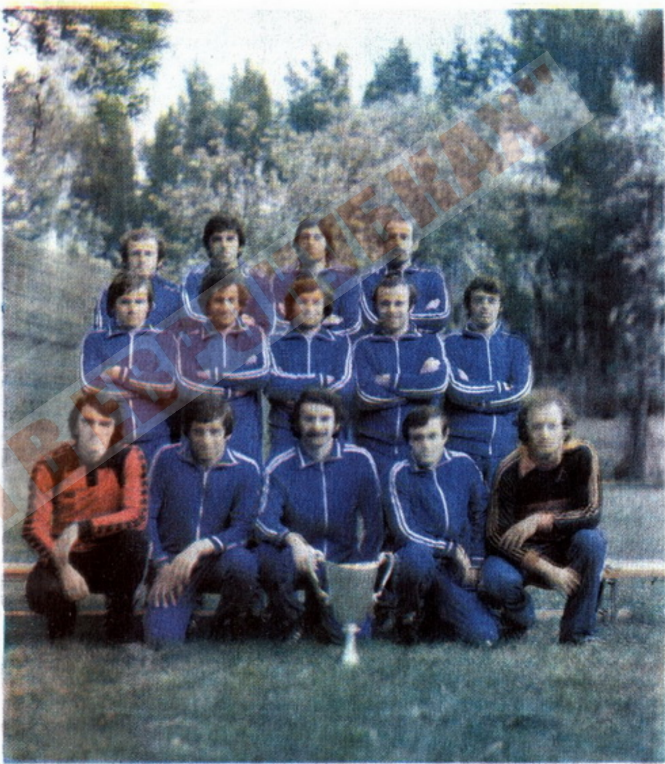
ევროპის თასების თასის მფლობელი თბილისის „დინამო“