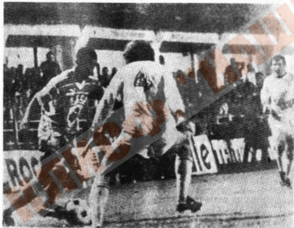
სურათზე: „ბასტიისა“ და „დინამოს“ პირველი შეხვედრის მომენტი.