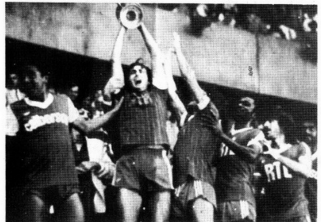
სურათებზე: საფრანგეთის თასის ფინალური მატჩის ეპიზოდები. „ბასტიის“ ფეხბურთელებმა ეს თასი ჩაიბარეს საპატიო პრიაზი.