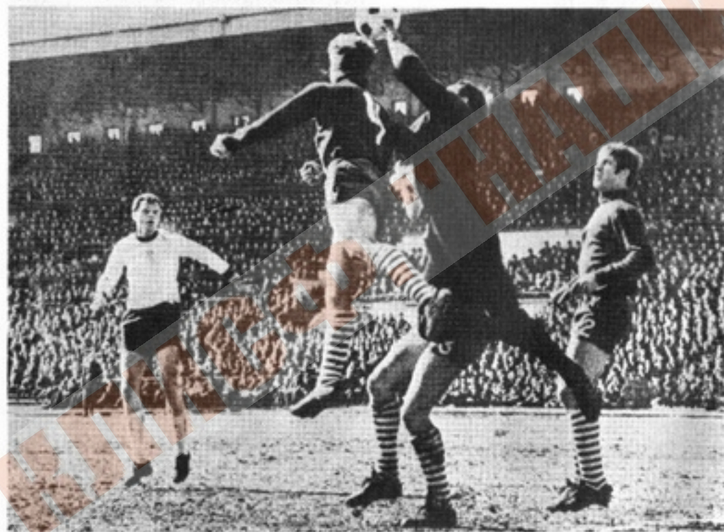
Матч «Гурник — Забже» — «Легия» (Варшава).

Все началось с поражения в 1/8 финала розыгрыша Кубка Польши от малоизвестной команды «Арка» из Гдыни—1:2. Затем последовали неудачи в чемпионате страны. После первого круга «Легия» с 14 очками занимает двенадцатое место в турнирной таблице (в высшей лиге выступают 16 команд). Команда одержала пять побед, четыре встречи свела вничью и шесть раз покидала поле побежденной, при от-