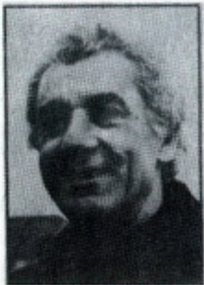
მ. ახალკაცი (მწვრთნელი)