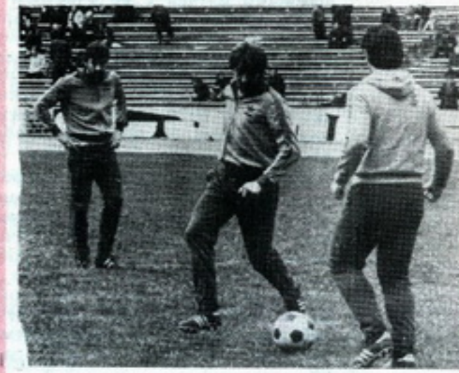
ფეიენოორდი — თბილისში