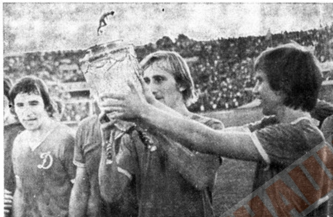
Долгожданный Кубок СССР в руках футболистов «Динамо»

Знакомство с румынской командой оказалось приятным. Немало аплодисментов досталось на долю вратаря Войнеску, показавшего не только надежную игру, но и эффектные акробатические прыжки. Поиравались и мобильный работоспособный Кэлиною, стремительные в атаке Иордаке и Ф. Завода, высокотехнический Петчовски и мощный центрфорвард таранного типа Озон.