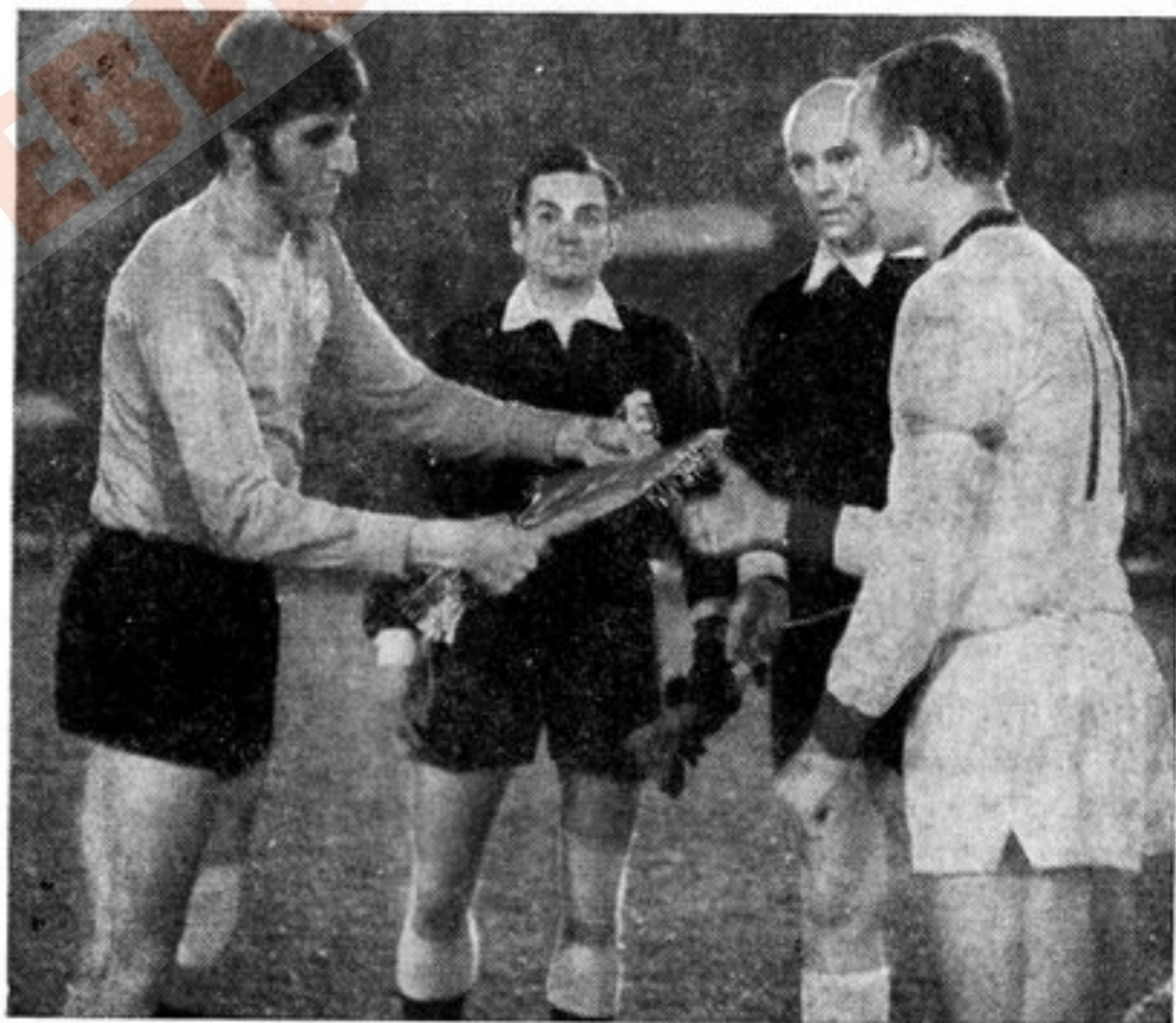
1971 г. Кубок обладателей кубков 1/8 финала «Динамо» (Москва) — «Эскишехирспор» (Турция)

Еще до начала очередного розыгрыша Кубка обладателей кубков многие зарубежные обозреватели признавали жеребьевку в этом турнире наиболее неудачной. В результате на первом же этапе из розыгрыша вывели такие сильные клубы, как «Глазго Рейнджерс» (Шотландия), которого вывел из борьбы голландский «Твенте». Малоизвестный испанский клуб «Реал» (Бетис) преградил дальнейший путь другому бывшему обладателю этого почетного трофея — итальянскому «Милану». Сошли с турнирной дистанции французский «Сент-Этьенн» и «Кельн» из ФРГ. Французы перед этим успели пережить несколько приятных дней, поскольку УЕФА дисквалифицировал было их соперника английский «Манчестер Юнайтед» за хулиганское поведение его болельщиков, приехавших на первый матч во Францию. Однако англичане подали жалобу, и апелляционное жюри изменило меру наказания. Дисквалификация была заменена штрафом в 30 тысяч швейцарских франков и переносом ответного матча в другой город, расположенный не менее чем в двухстах километрах от Манчестера. Этим городом стал Плимут, на стадионе которого «Манчестер» одержал победу и вышел в следующий круг.