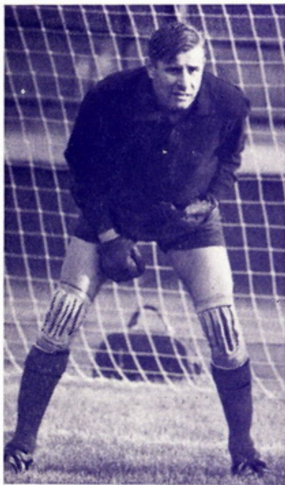
Лев Яшин — прославленный вратарь московского «Динамо», ныне начальник команды

Второй гол забивает Якушин. Происходит это на 7-й минуте второго тайма. Он бьет в правый угол ворот. Мяч проходит низко. Вратарь бросается, но не успевает его взять. Еще через 17 минут третий гол забивает Семичастный. За несколько минут до конца игры Якушин забивает четвертый мяч. Счет 4:0.