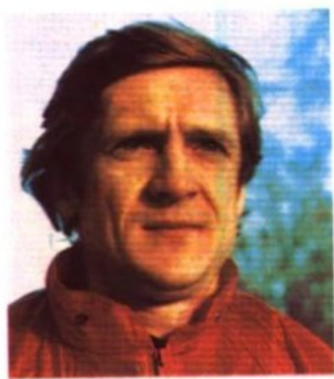
Ігор Беланов Игорь Беланов Igor Belanov