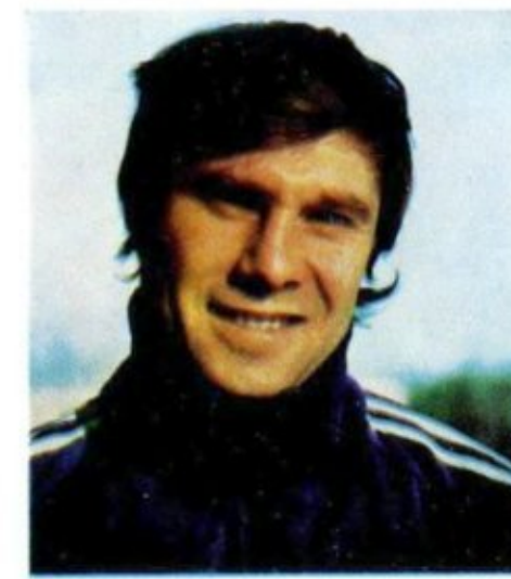
Сергій Балтача Сергей Балтача Sergei Baltacha