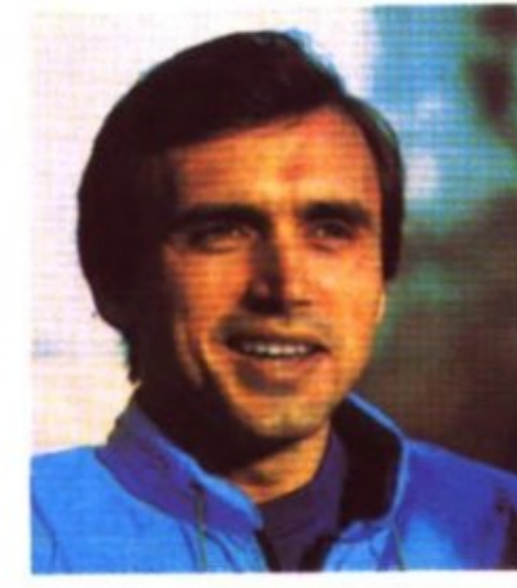
Олександр Заваров Александр Заваров Alexander Zavarov