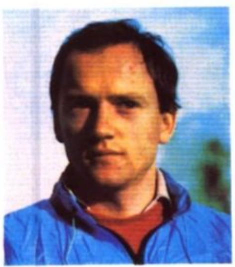
Олег Блохін Олег Блохин Oleg Blokhin