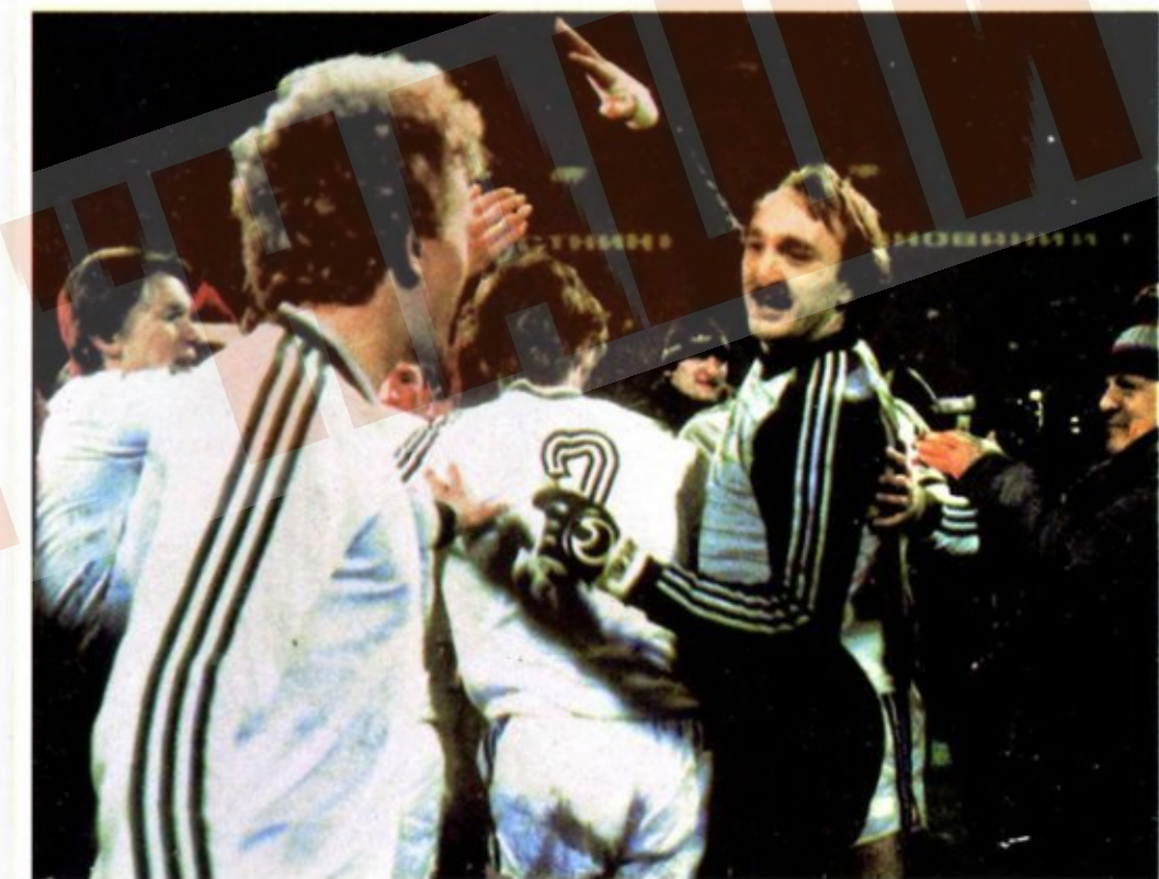
Радість перемоги... Радость победы... The joy of victory...

Футбольная команда «Динамо» (Киев) создана в 1927 году. Она является участником всех 49 чемпионатов СССР, проводимых с 1936 года.