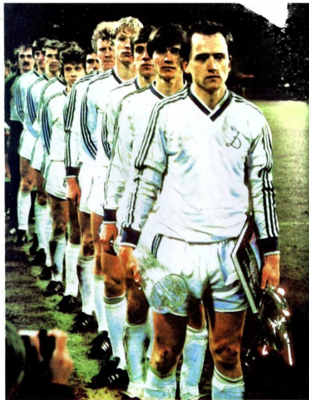
Лауреати футбольного сезону-86 Лауреаты футбольного сезона-86 Winners of the 1986 football season