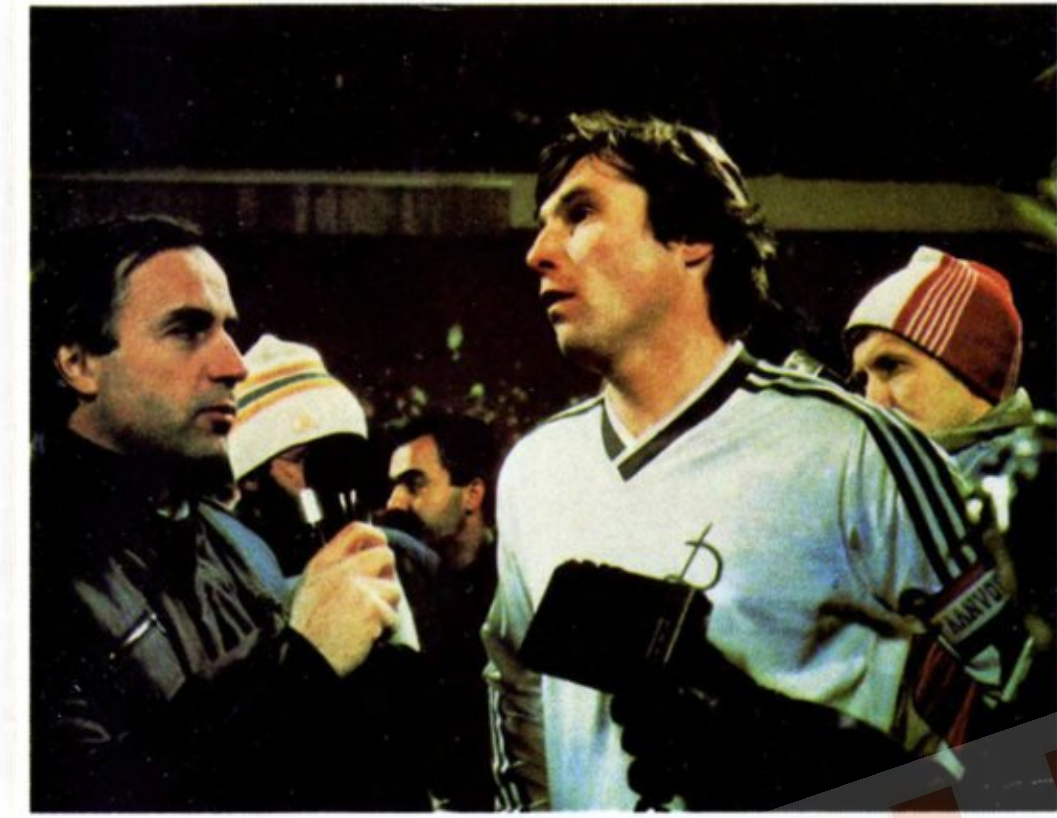
Інтер'ю дає капітан Інтервью дает капитан The captain gives an interview

Дванадцятиразовий чемпіон СРСР. Десятиразовий срібний та дворазовий бронзовий призер першостей країни. Семиразовий володар Кубка СРСР. Дворазовий переможець розіграшів Кубка європейських кубків, володар Суперкубка УЄФА. Команда, що виховала 37 заслужених майстрів спорту... Перелік достойнств сьогоднішнього київського «Динамо» можна ще й ще продовжувати. Тож не поспішаємо ставити крапку. Уболівальники вірять, що нинішній набуток колективу — то основа для здобуття нових футбольних вершин на славу радянського спорту.