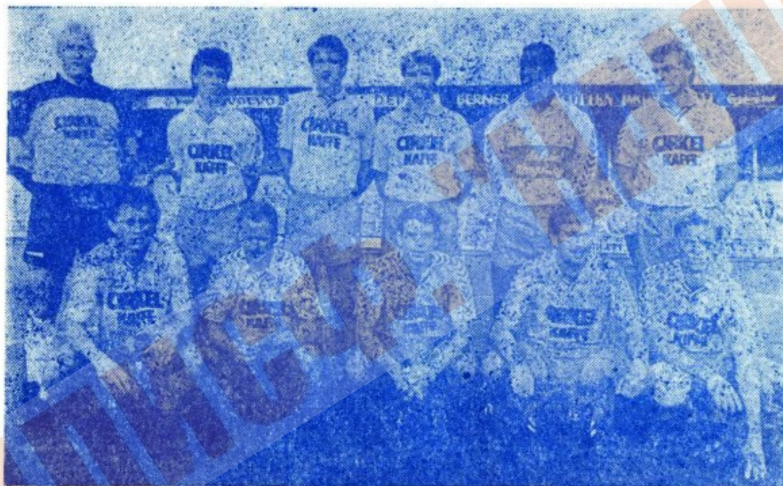
«Брондбю» — чемпион и обладатель Кубка Дании 1990 г.

Ну, а теперь подробнее о сегодняшнем сопернике киевлян — бесспорном лидере датского футбола последнего пятилетия — клубе «Брондбю».