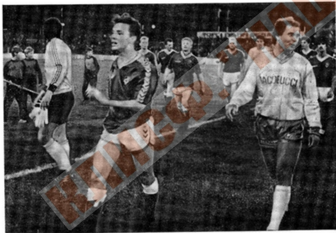
«Днепр» — «Линфилд». Матч закончен.