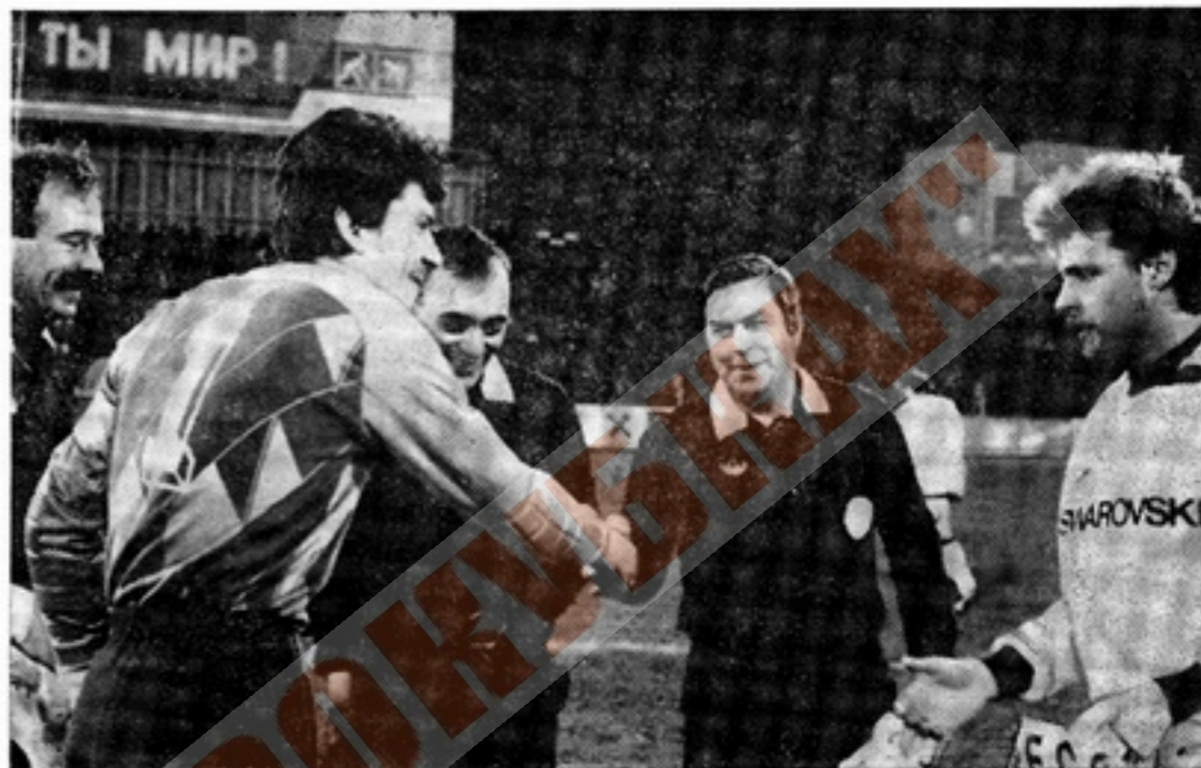
Три года назад в Симферополе встречались московский «Спартак» и «Сваровски-Ваккер» (нынешний «Тироль»). На снимке: перед началом матча на кубок УЕФА.