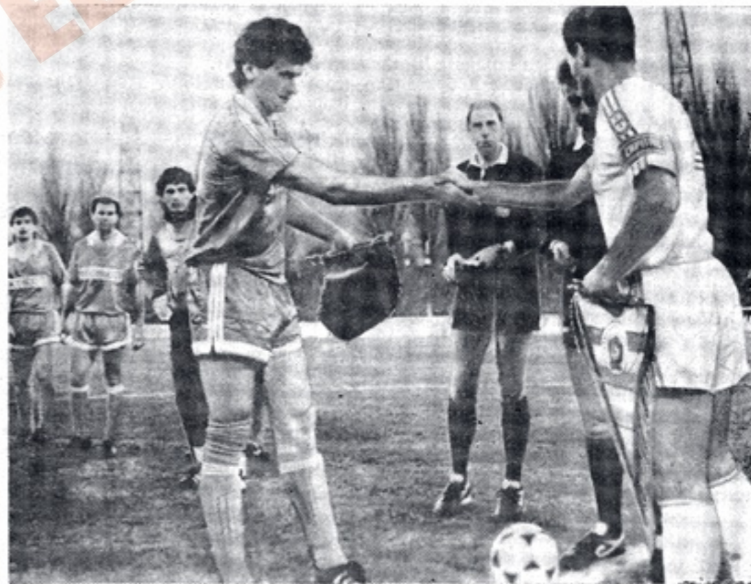
Перед встречей «Днепр» — «Бенфика»: рукопожатие капитанов.

Первый матч Кубка УЕФА «Днепр» провел против «Висмута» из ГДР и добился успеха — 3:1. Всего же в 10 матчах Кубка УЕФА на счету «Днепра» по 3 победы и ничья, а 4 встречи проиграно (мячи — 10:11).