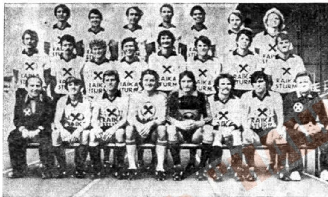
Команда «Райка-Штурм» (Грац)

Никто точно не знает, как пришло к клубу его название, но легенда гласит, что решающую роль в этом сыграла погода: «Штурм» в переводе с немецкого — буря. Выражение силы, настойчивости и непреклонности, которое должно было