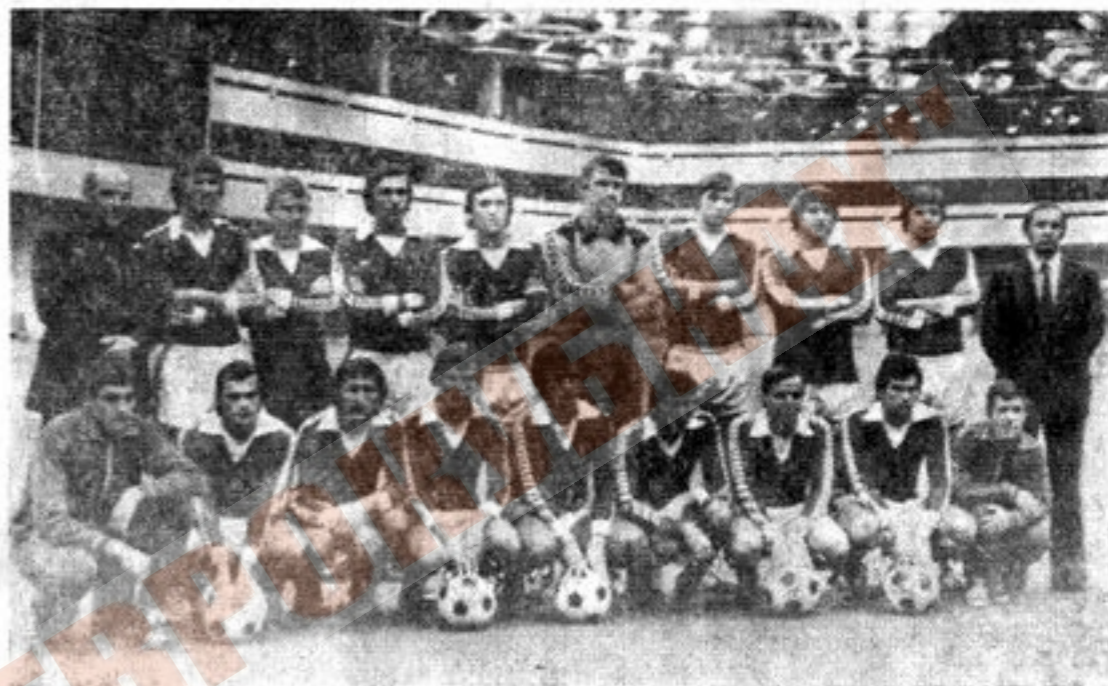
Команда ЦСКА, занявшая 5-е место в чемпионате СССР 1980 г.

По числу завоеванных титулов чемпиона СССР армейцы Москвы уступают лишь столичным «Динамо», «Спартаку» и киевскому «Динамо». Шесть раз (в 1946, 1947, 1948, 1950, 1951 и 1970 гг.) команда становилась сильнейшей в стране, трижды (в 1938, 1945 и 1949 гг.) была второй и шесть раз (в 1939,