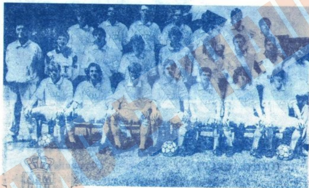
Один из лидеров французского футбола — клуб АС «Монако».

Первый крупный успех пришел к монегаскам (так называют во Франции жителей Монако и ее футболистов) в 1960 году, когда в финале Кубка Франции, на парижском «Парк де Пренс» футболисты «Монако» вырвали в дополнительное время победу у «Сент-Этьенна» — 3:2. А уже в следующем сезоне команда, впервые стала чемпионом Франции. Через два сезона в 1963 году — новый ус-