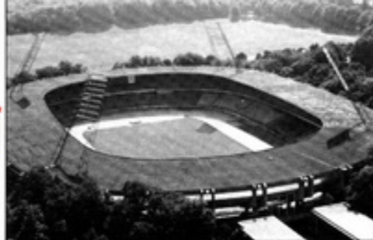
Die Entscheidung... Weltmeisterschafts-Qualifikationsspiel