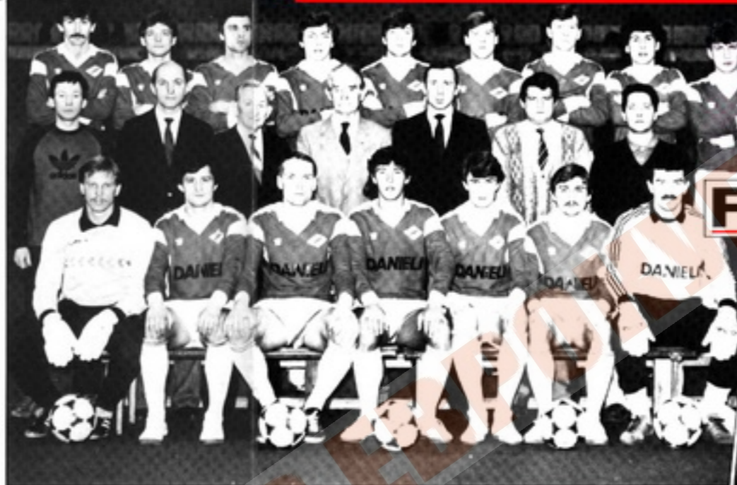
Das ist die Mannschaft, die den 1. FC Köln aus dem UEFA-Cup „wippen“ will: Russlands neuer Meister Spartak Moskau