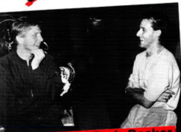
Besuch bei Boris Becker

An diesem Abend und in der Domstadt wird es sich entscheiden, ob die Deutsche Fußball-Nationalmannschaft an der WM '90 teilnimmt. Die Voraussetzungen sind nach dem 6:1 über Finnland ausgesprochen gut, aber: Nur ein Sieg bringt Franz Beckenbauer und das Nationalteam weiter. Es gibt noch vereinzelt Eintrittskarten für das letzte und entscheidende WM-Qualifikationsspiel an den bekannten Verkaufsstellen sowie beim Ausrichter, dem Fußball-Verband Mittelrhein, Kleingedankstr., in Köln 1.