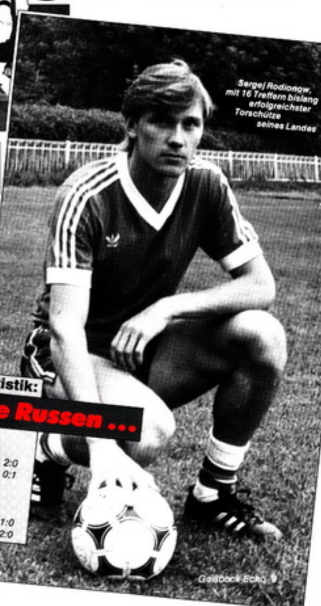
Sergej Rodionow, mit 16 Treffern bislang erfolgreichster Torschütze seines Landes